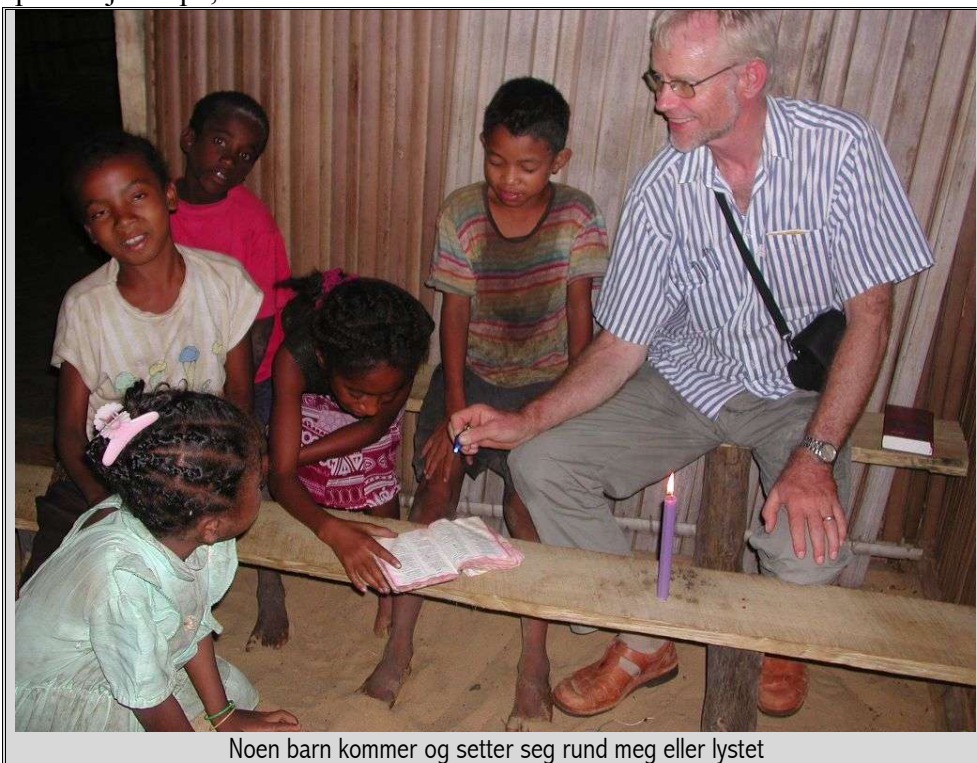
Noen barn kommer og setter seg rundt meg eller lystet