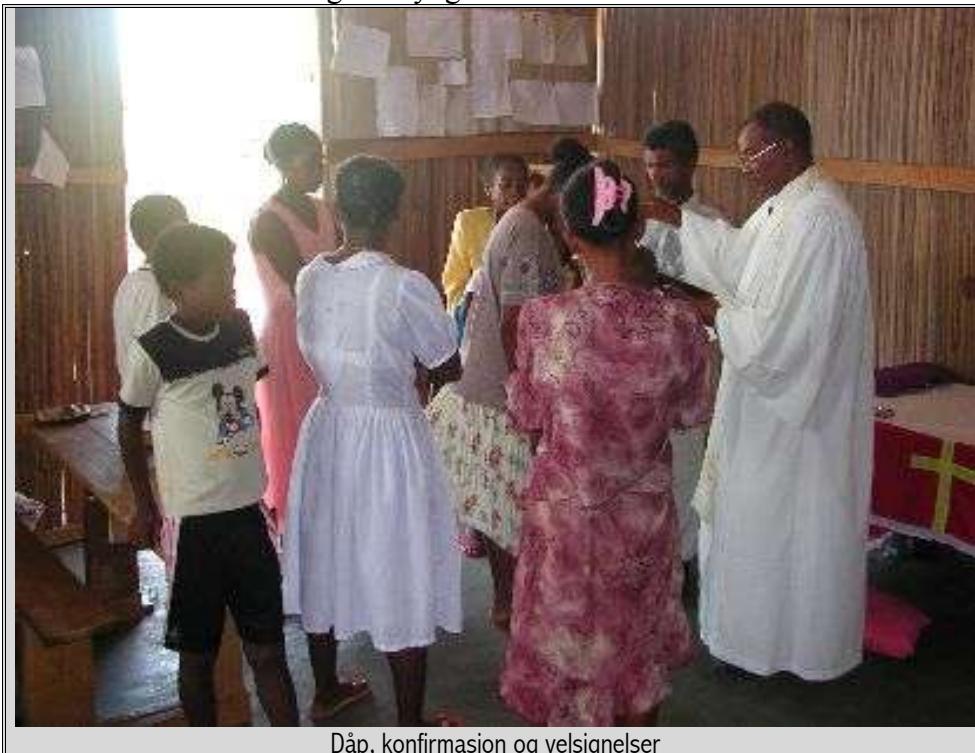
Dåp, konfirmasjon og velsignelser