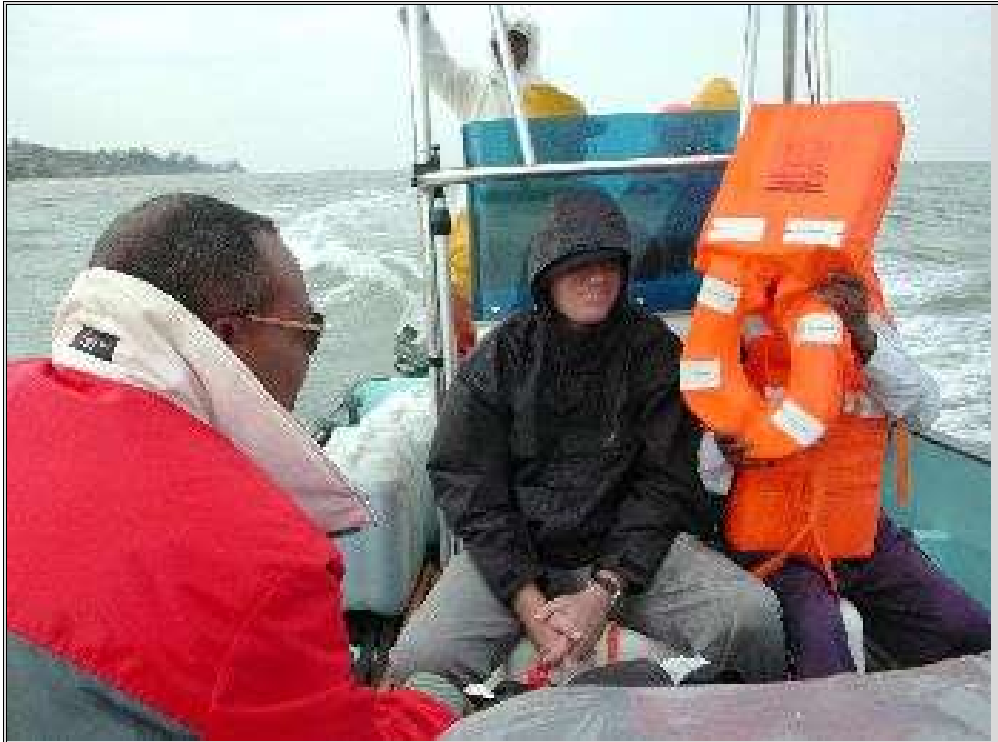
Evangelisten prøver å beskytte seg mot den verste spruten med å holde en redningsvest foran seg uten at det ser ut til å hjelpe noe.