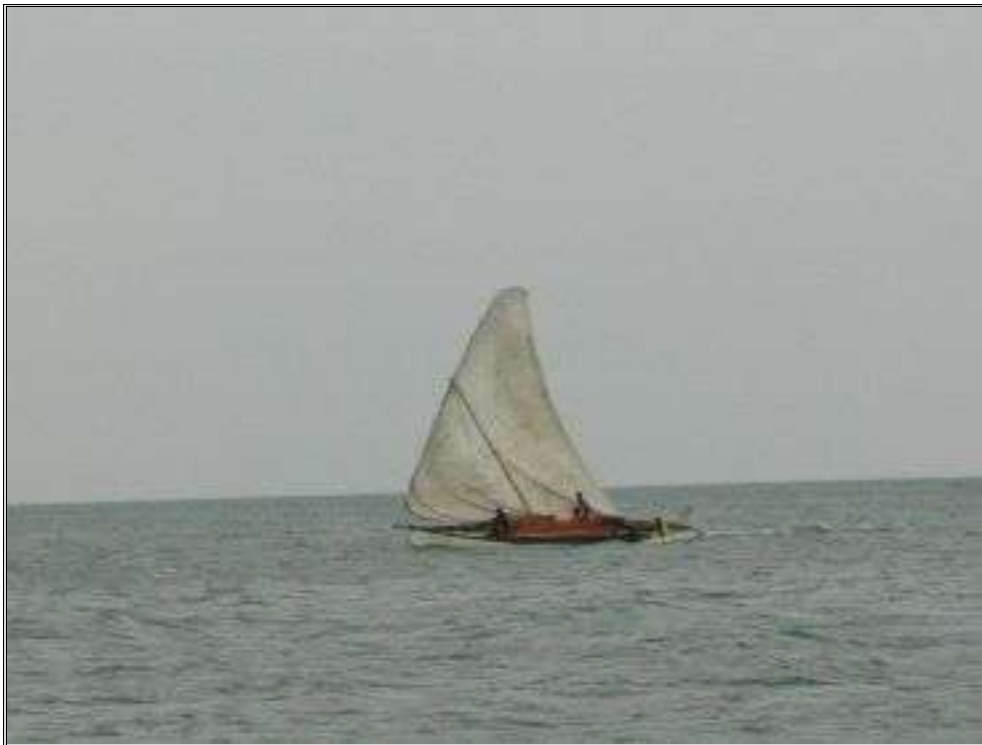
Vi passerer all slags farkoster. De aller fleste er seilbåter.