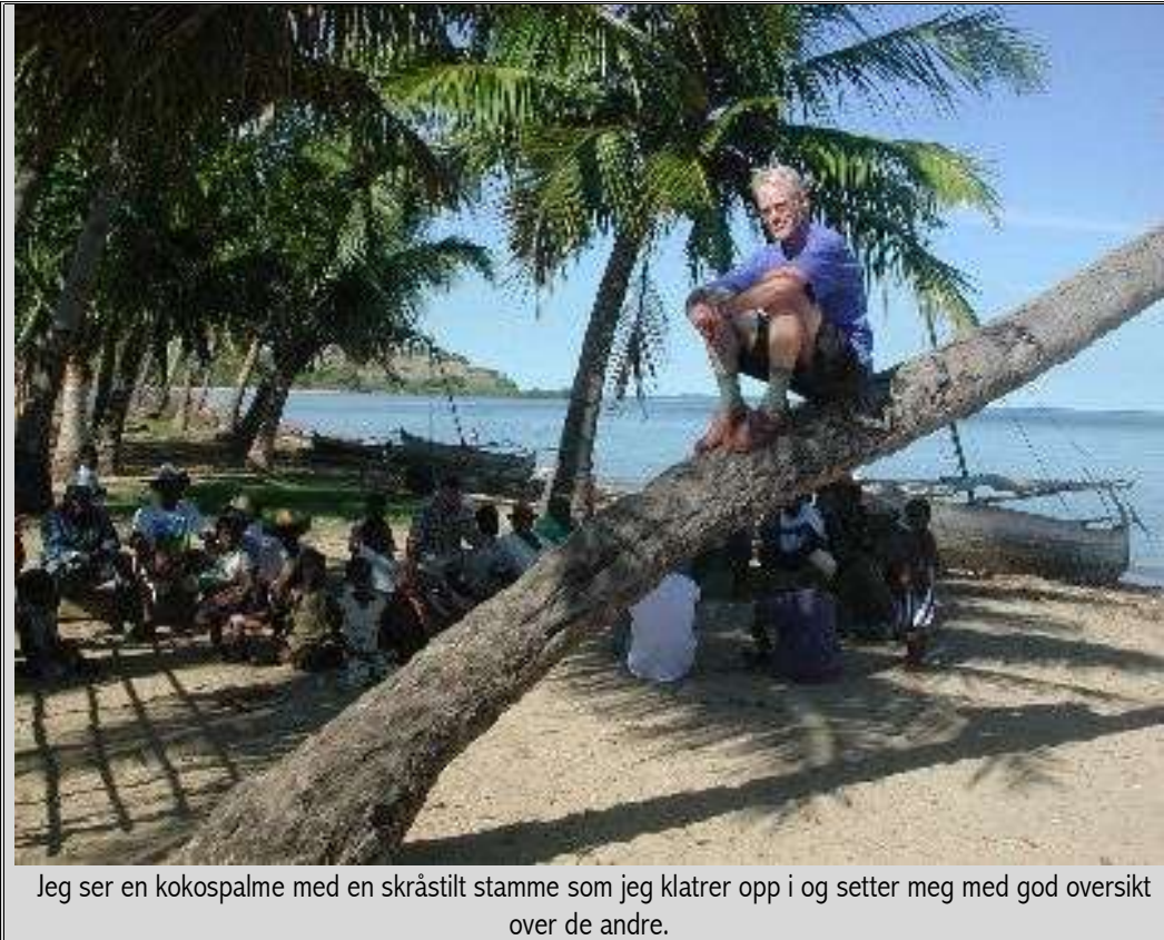
Jeg ser en kokospalme med en skråstilt stamme som jeg klatrer opp i og setter meg med god oversikt over de andre.