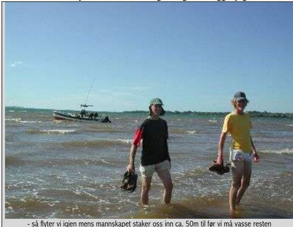
- så flyter vi igjen mens mannskapet staker oss inn ca. 50m til før vi må vasse resten

bad, mens de andre ser på. Jeg blir som et barn når jeg kan bade under slike forhold. Det klare vannet er varmt. Jeg tar tak i ankerkjettingen og følger den til bunns. Gasserne er tydeligvis ikke like glad i å bade som oss. Jeg vet ikke hvorfor. Kanskje er de redde for hai for det finnes vist. Jeg så ingen, heldigvis! Vi har kanskje stanset en times tid, men må videre. Klokken er blitt omtrent 11:00. Vi skal spise lunsj i Analalava, (den lange skogen). Her er det enda mer langgrunt en det var i Andamoti. Vi tar så vidt bunnen mens vi enda er 100m fra land, men så flyter vi igjen mens mannskapet staker oss inn ca. 50m til før vi må vasse resten. Restauranten ligger rett ved stranden der båten har ankret opp. Vi setter oss ved tre av de ledige bordene. Det er mange bord her. De fleste er ledige. Veggene er åpne og den varme luften er behagelig i skyggen fra taket. Det var høyt under tak. Særlig opp under mønet. Opp under dragerne i taket var det festet lysstoff rør. Som tidligere fagmann legger jeg merke til det