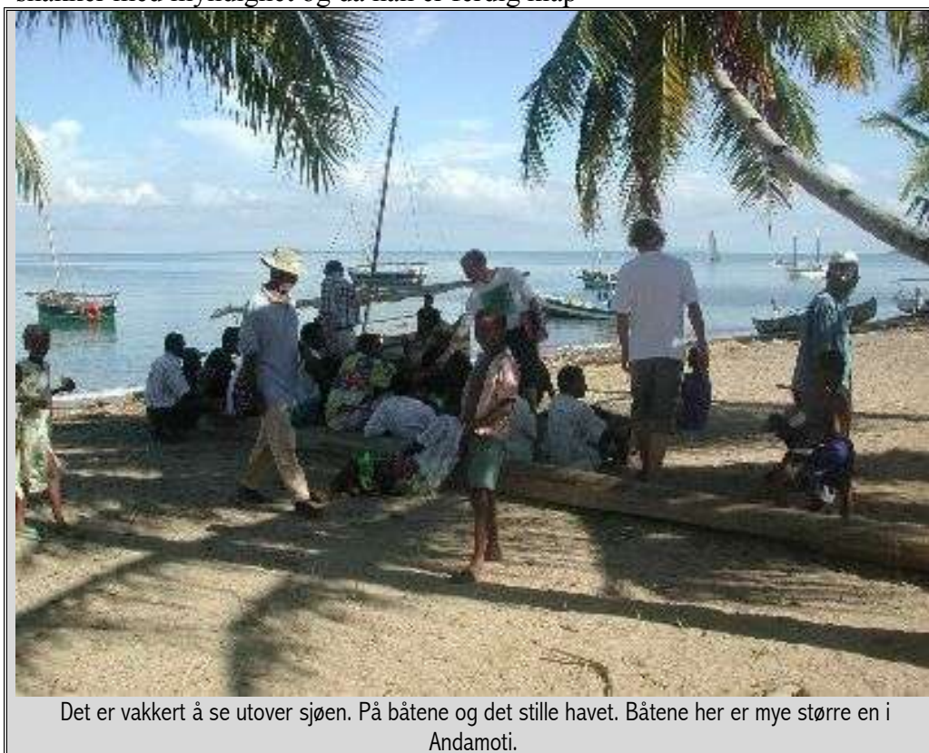
Det er vakkert å se utover sjøen. På båtene og det stille havet. Båtene her er mye større en i Andamoti.