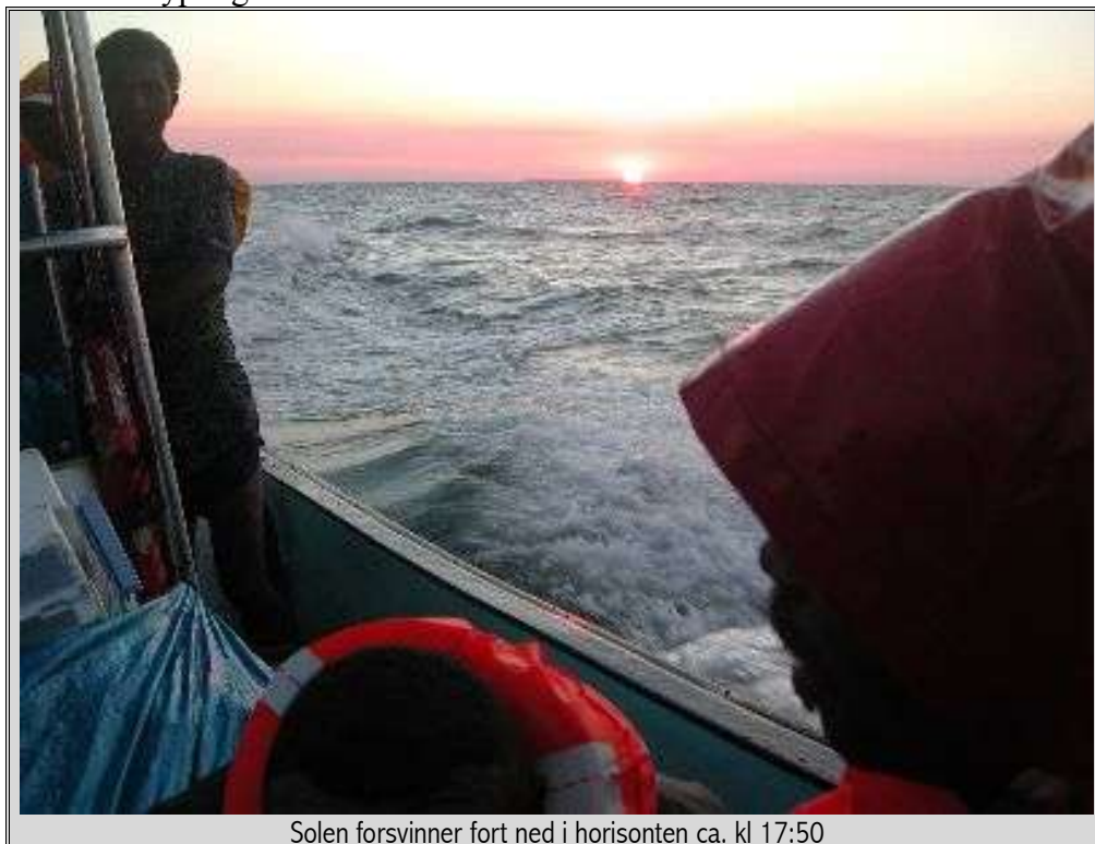
Solen forsvinner fort ned i horisonten ca. kl 17:50