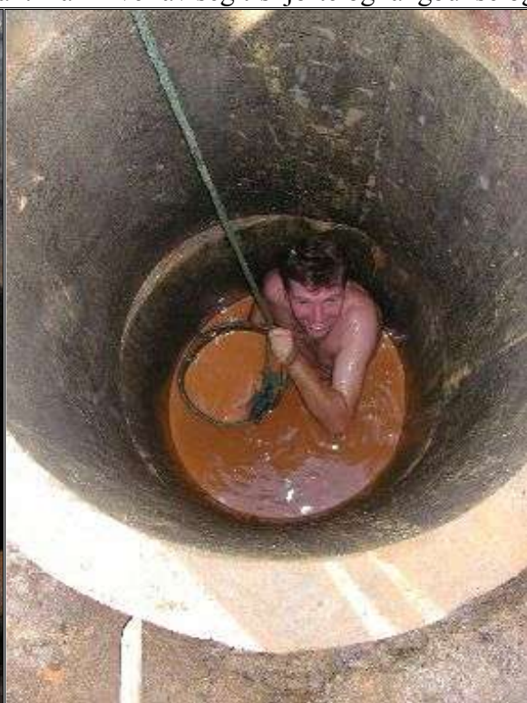
Han forsvinner under vannflaten for og dukke smilende opp igjen med bøtta i hendene full av vasstukken sand

krabber ned igjennom betongringene og blir stående med bare hodet over vannet. Han ber om å få bøtta firt ned til seg, tar tak i den, og forsvinner under vannflaten for og dukke smilende opp igjen med bøtta i hendene full av vasstukken sand som blir heist opp og tømt ut i den røde sandhaugen som ligger ved siden av brønnen. På bunnen skal det legges et tykt lag med pukkstein som de tre steinknusende menn jobber med. Det har blitt så mye vann at brønnen må lenses før de kan grave dypere. "Shalom-prosjektet" har skaffet en bensindrevet