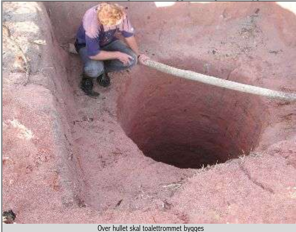
Over hullet skal toalettrommet bygges