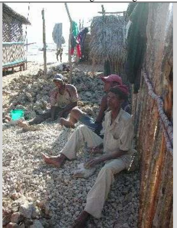
Det sitter tre mann opp på haugen og knuser steinene til pukkstein med hver sin hammer.

foran hyttene danner en gate. Bagasjen blir plassert i en bambushytte som tilhører evangelisten. I et gatekryss utenfor hytta ligger en stor steinhaug. Steinen er hentet på den andre