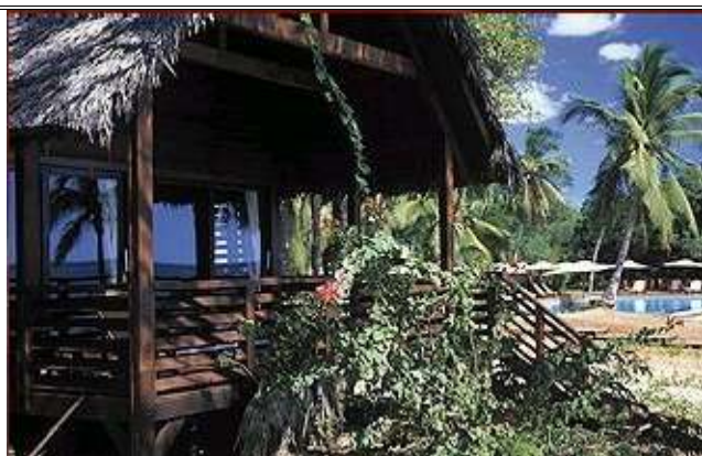
På avstand minner de om vanlige gasser hytter, men når vi kommer nærmere, ser vi at dette er byggverk av en helt annen standard. Det er mørkbeisede trehytter med stråtak.