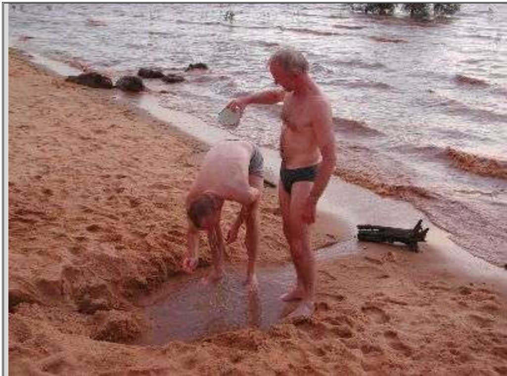
Vi tar i mot tilbudet og dusjer hverandre med skålen