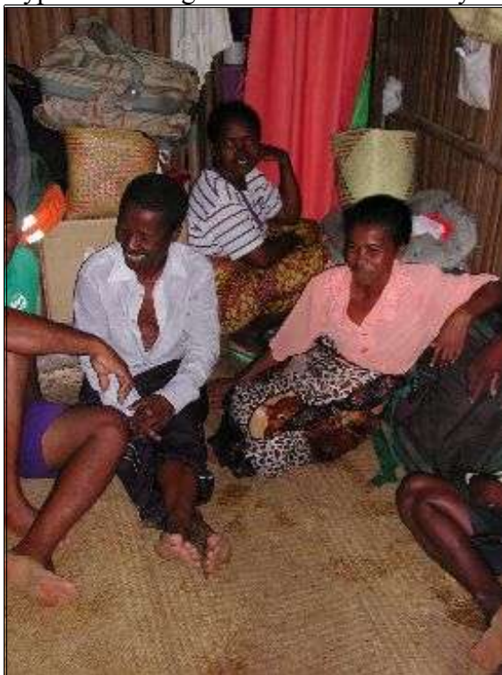
Vertskapet vårt i Andamoti